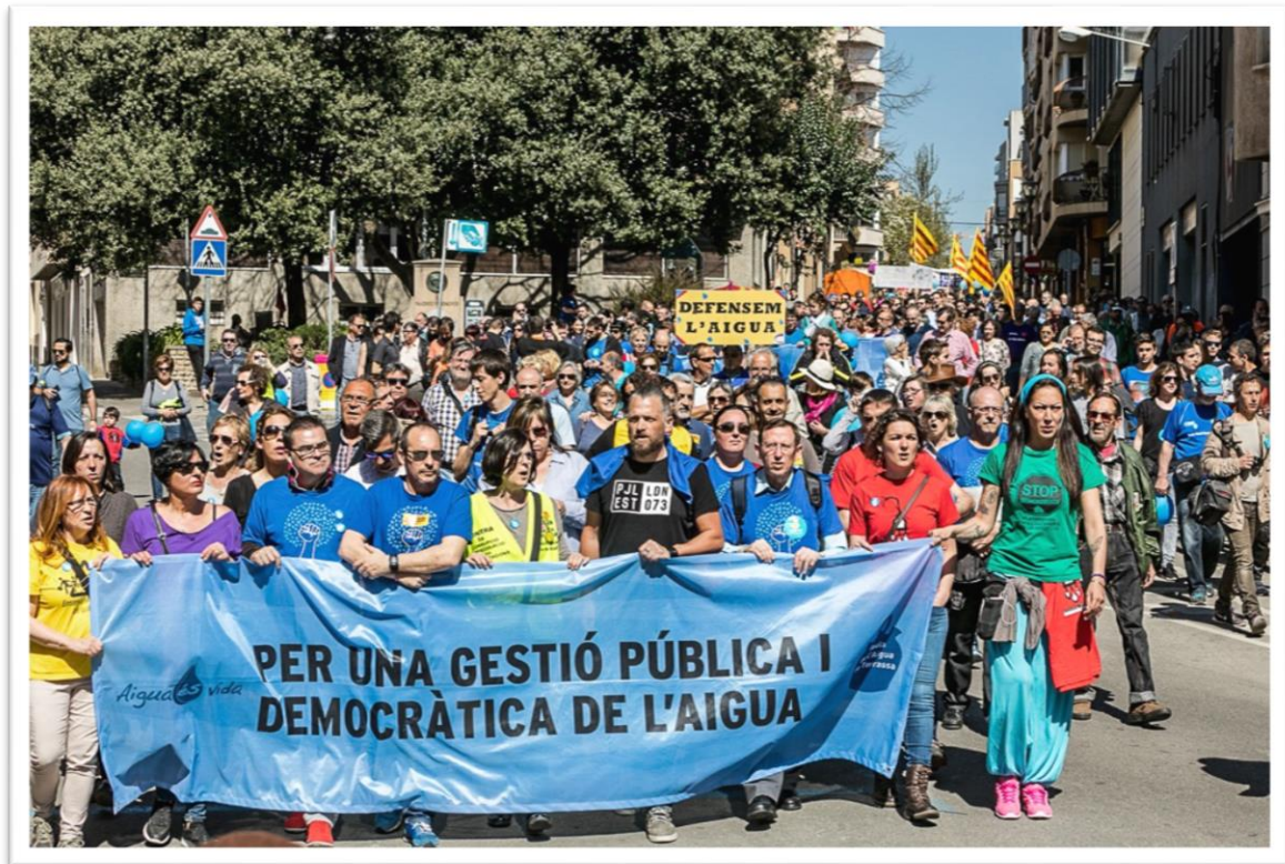
Manifestació per la gestió pública de l'Aigua a Terrassa.

Com a cas paradigmàtic em sembla interessant estudiar-lo i entendre quines són les dinàmiques que faciliten o dificulten la gestió d'un bé comú com l'aigua des d'una perspectiva comunitària. Per altra banda, m'interessa també veure com model és pot aplicar en altres experiències de re-municipalització de l'aigua, comptant amb la participació comunitària i el coneixement per part de la població entorn la realitat d'un recurs com l'aigua i de l'impacte de la seva utilització sobre el medi natural des d'una òptica ecologista i de conservació del mateix.